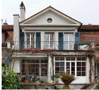
Prix des monuments historiques 2012, Köniz-Wabern, Sprengerweg : avant – après

Avec ta classe, vous rendez visite à un ou une architecte de l'endroit.