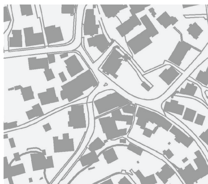
Ecole au numéro 2 de la Jungfraustrasse à Thounne

Sur un plan, trace le chemin que tu empruntes pour te rendre à l'école et indique les monuments qui s'y trouvent. L'enseignant te donnera des informations à ce sujet. Tu peux aussi consulter le site → www.bit.ly/recensement-architectural-en-ligne ou utiliser l'application gratuite « denkmappBE ».