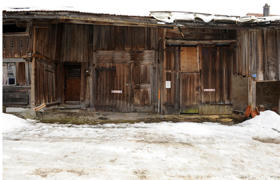
La « Tätschdachhaus » de Schwarzenbourg avant son assainissement.

L'enseignant ou un spécialiste du Service des monuments historiques vous accompagne dans une visite qui vous permettra de découvrir l'histoire de la localité et de ses principaux bâtiments et ouvrages.