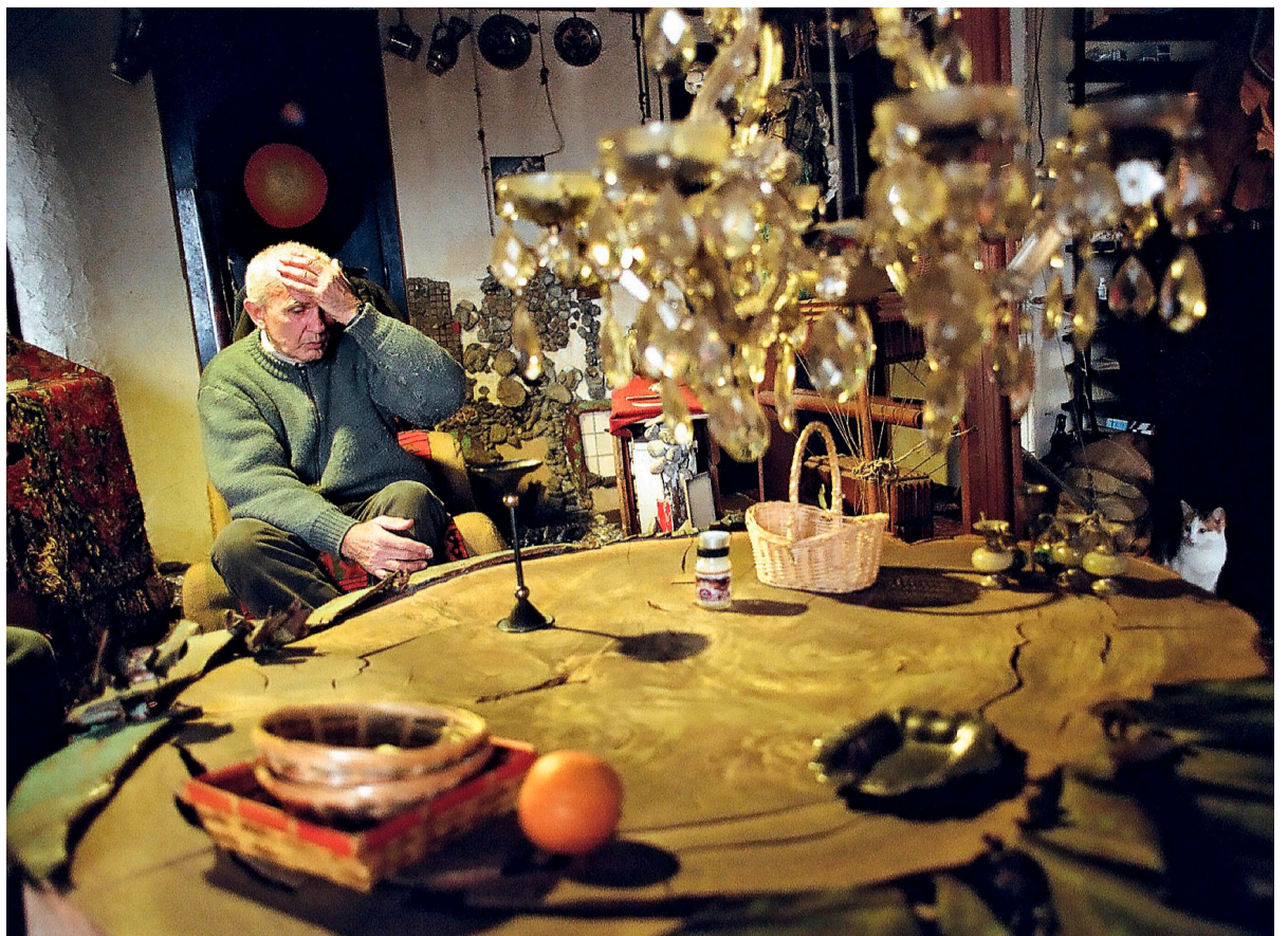
Es ist staubig hier, aber trotz faszinierendem Durcheinander erstaunlich sauber, sogar recht ordentlich und wohnlich.