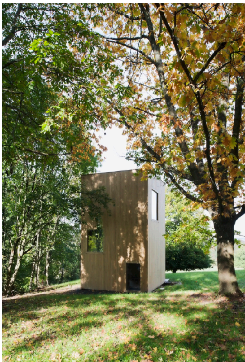
Fünf dieser Türmchen stehen in einem Freiburger Obstgarten.

Bis Ende Jahr soll ein drittes Haus das Ensemble komplettieren. Mit 128 Quadratmeter wird es kleiner sein als ein typisches Einfamilienhaus, die architektonische Dichte indes liegt um ein Vielfaches höher. Allerdings hat die Bauqualität ihren Preis: Wer ein Haus mieten will, bezahlt in der Hochsaison bis zu 4800 Franken pro Woche. Dass auch auf