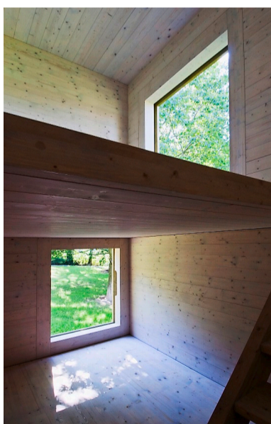
Das Büro LVPH plante die Häuser auf einer Grundfläche von 5,5 mal 5,5 Meter.

Die drei Beispiele zeigen, wie auf kleinem Raum grosszügige Architektur ent-