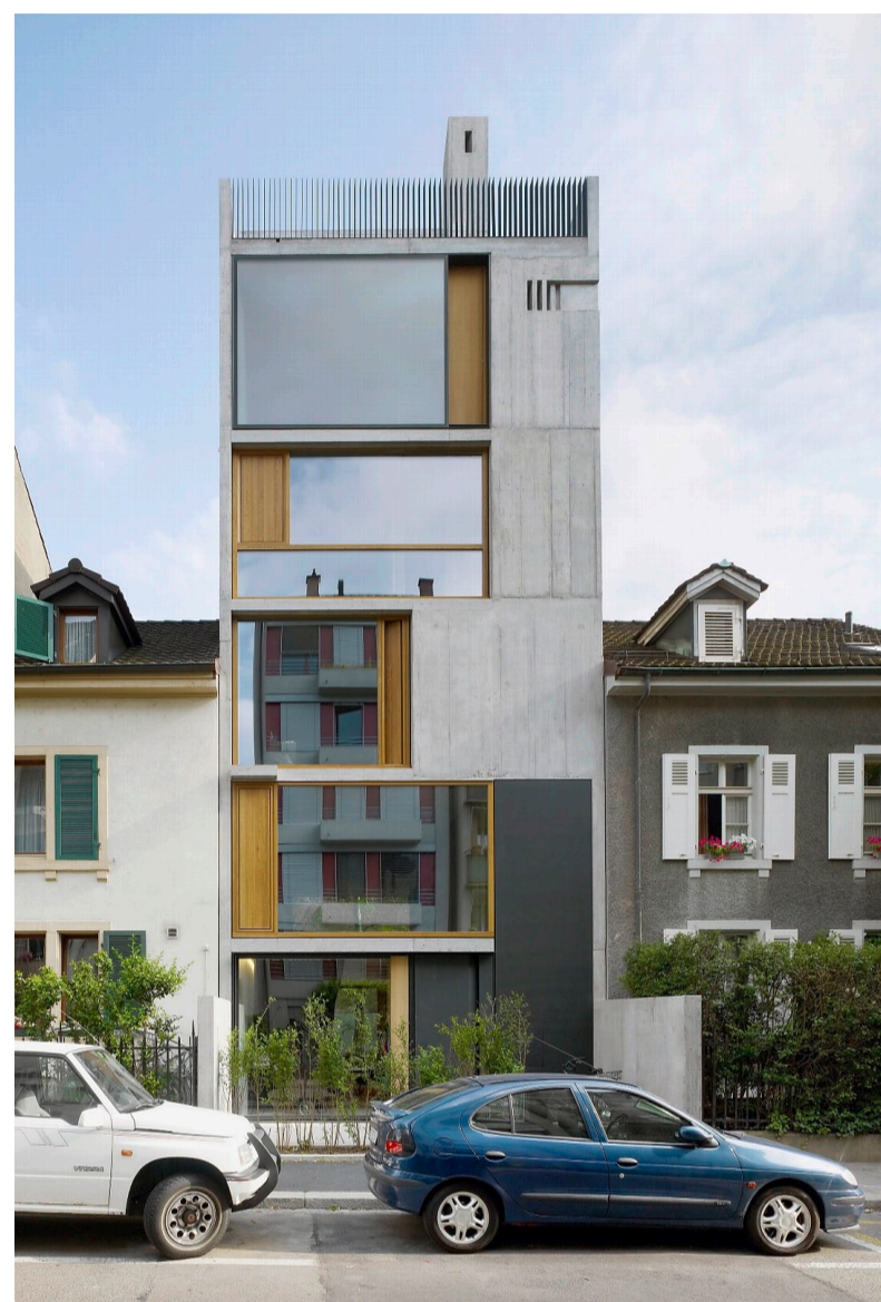
In die Lücke gebaut: Stadthaus von Buchner Bründler Architekten.

steht. Dennoch: Das Einfamilienhaus ist nicht die schlankste Wohnform, es verbraucht viel Land und Ressourcen, auch wenn es sich mit Minergie-Label brüstet. Doch es gibt auch grosse Wohnüberbauungen, die den Gürtel enger schnallen, wenn auch bislang nur auf dem Papier. Mit der Siedlung Hornbach will die Stadt