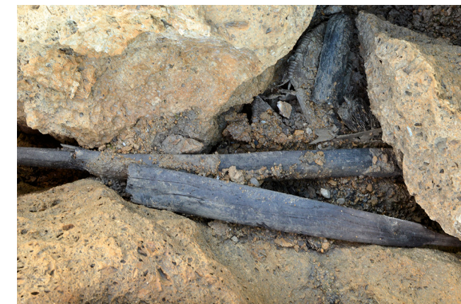
La boîte en bois de l'Âge du Bronze ancien et une partie de l'arc à leur emplacement de découverte entre deux grosses pierres.