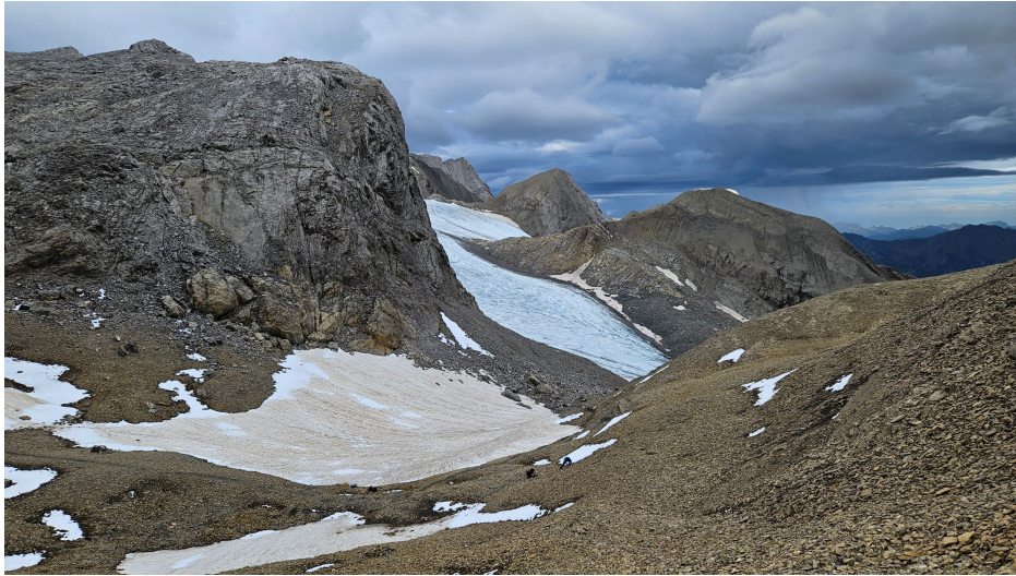
Schnidejoch mit Firnschneefeldern. Aus den Schneefeldern stammen die gletscherarchäologischen Funde.